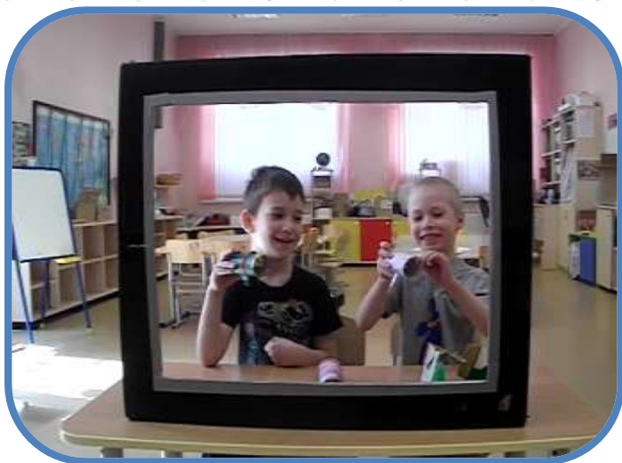
Краб и акула