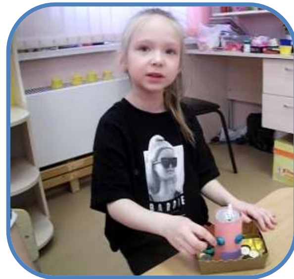
Шкатулка для пуговиц