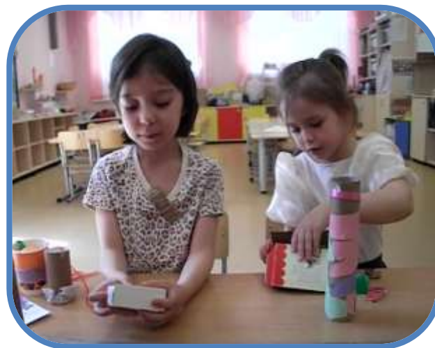
Игрушки для пальчиков, копилка,