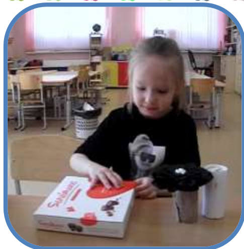
Игрушки для питомца