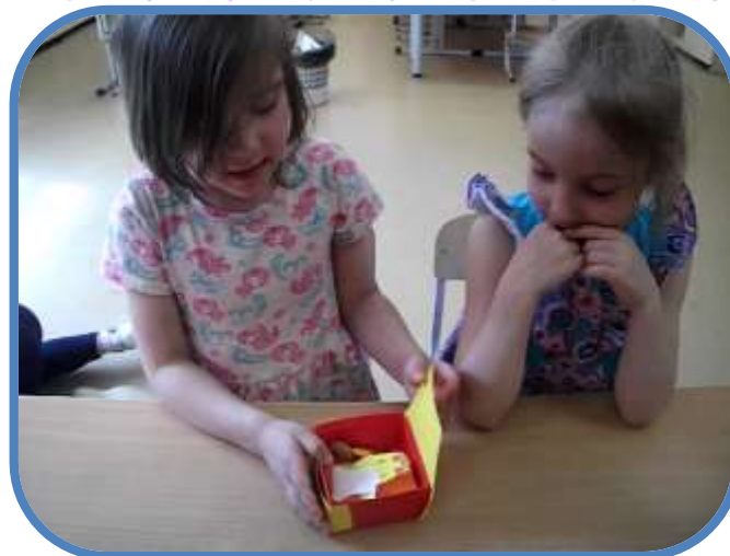
Домик для котика