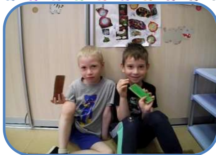
Ключ от дверей