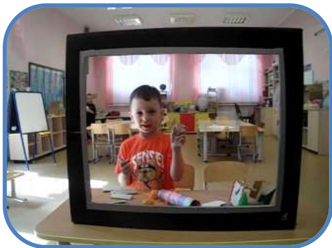
Деньги и банковские карты