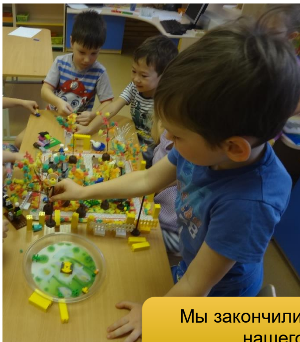
Мы закончили обустройство нашего парка