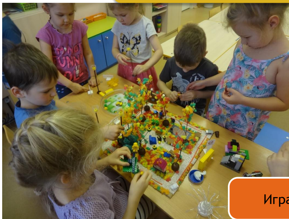
Играем с нашим макетом